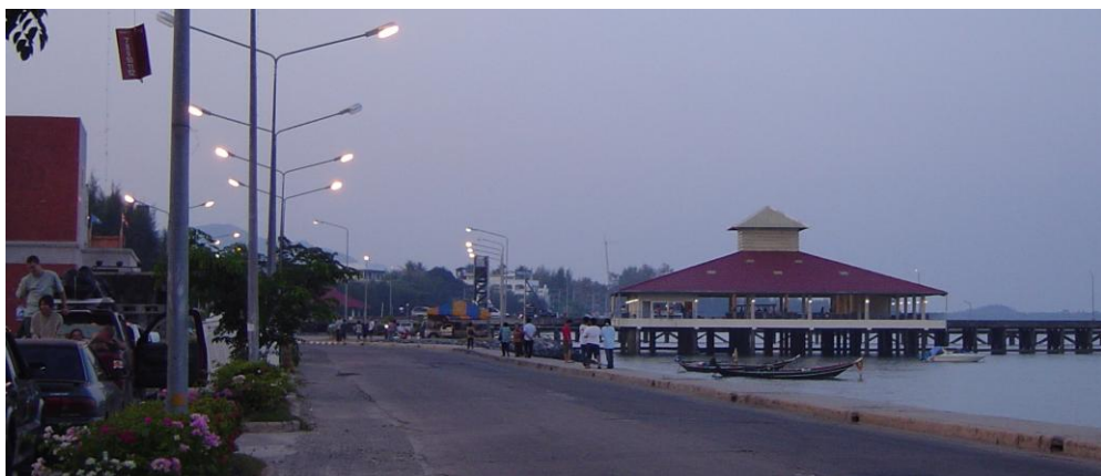
รูปที่ 60 เกาะสมุยแหล่งท่องเที่ยวด่านอ่าวไทย

หากถามว่า ถ้าจะไปเที่ยวเกาะสมุยจะต้องเตรียมอะไรไปบ้าง แวนตากันแดด ร่ม รองเท้าแตะ ต้องจอง ห้องพักรักด้วยไหม่ กล้องถ่ายรูปจะนำไปด้วยหรือเปล่า คำถาม ต่าง ๆ เหล่านี้จะถูกจำกัดลงไปได้ทันที หากเราพิจารณาว่าจะไปทำอะไร ที่ไหน อย่างไร นั่นคือจะต้องมีจุดประสงค์เอาไว้ก่อนในเบื้องต้น