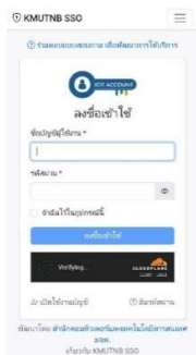
รูปที่ 1 การเข้าระบบผ่าน ICIT Account