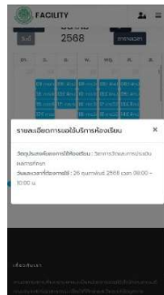
รูปที่ 2 การดึงข้อมูลตารางสอน