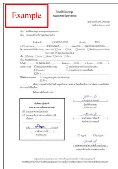
รูปที่ 3 ตัวอย่างเอกสารอิเล็กทรอนิกส์